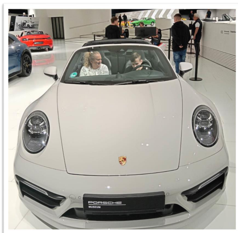
Obr. č. 3: Porsche múzeum