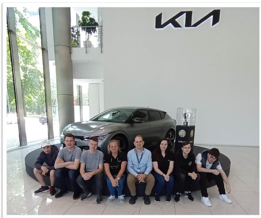
Obr. č. 1: Centrála Kia Europe - tréningové centrum