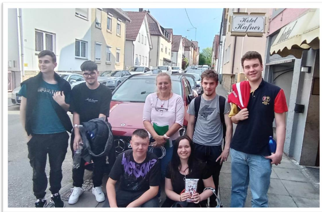
Obr. č. 2: cesta do Nemecka