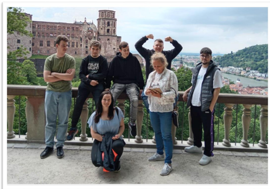
Obr. č. 4: Hrad Heidelberg