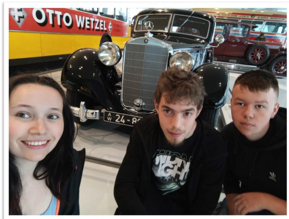
Obr. č. 4: Mercedes Benz múzeum Stuttgart