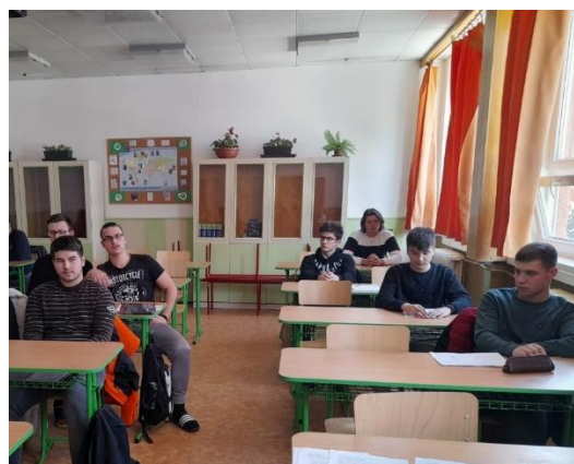
Obr. č. 11 a 12: Hodnotiace stretnutie účastníkov mobilit