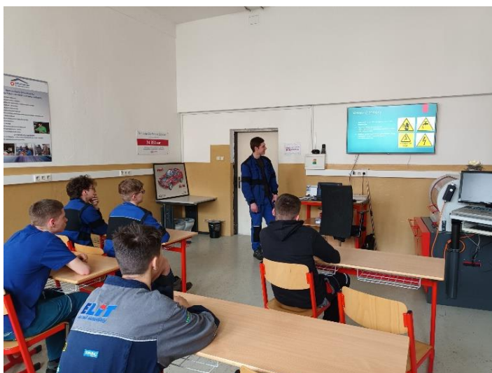
Obr. č. 9 a 10: Odborné prezentácie účastníkov mobilit