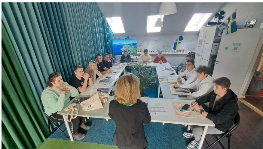
Obr. č. 7: Závěrečné stretnutie 2. mobility vo Švédsku