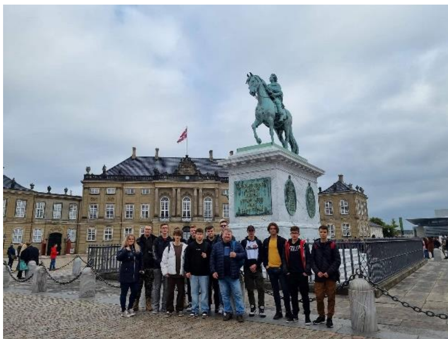
Obr. č. 6: Výlet do Kodane