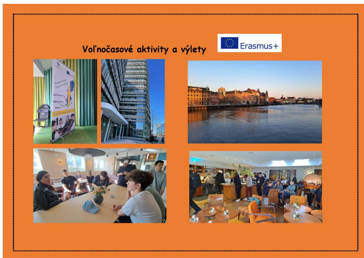
Obr. č. 2: Malmö, Švédsko – mesto a miesta, v ktorých sme pôsobili

pravidelne sa zúčastňovať na projektoch Erasmus+ a vybudovať tradíciu EU Mobilít