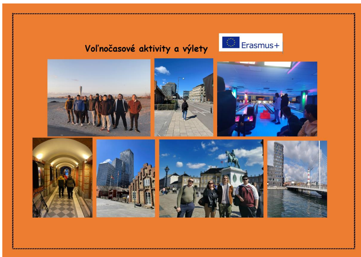
Obr. č. 4: Malmö, Švédsko – aktivity počas pobytu