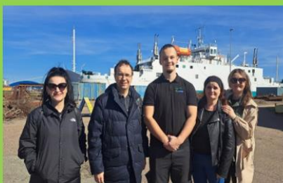
Obr. č. 3: Monitorovacia návšteva vedenia školy počas 2. turnusu