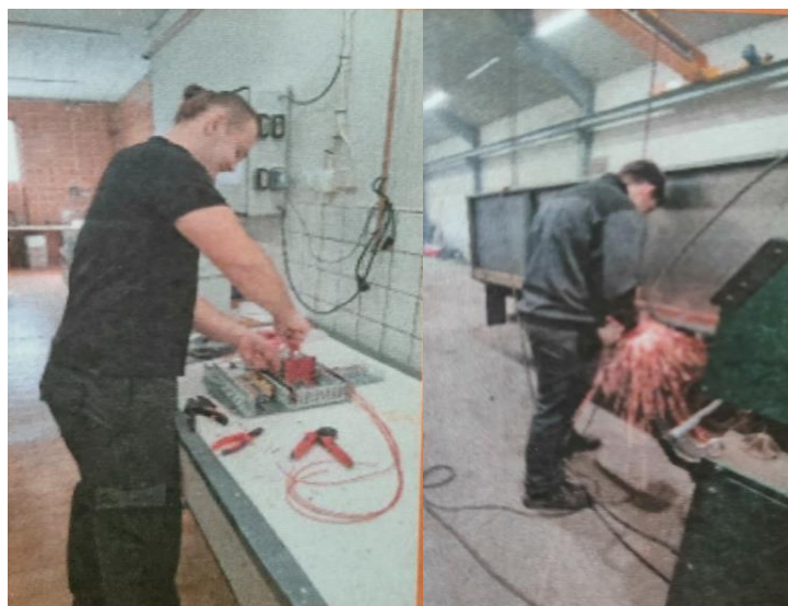
Obr. č. 5: Naši žiaci vo firmách v Malmö