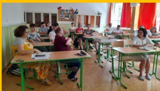
Obr. č. 8: Vyhodnocovacie stretnutie 2. mobility vo Švédsku